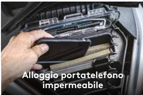
Alloggio portatelefono impermeabile

Esclusivo sistema di attacco rapido sulla piattaforma da bagno più ampia del settore per una facile installazione degli accessori di carico.