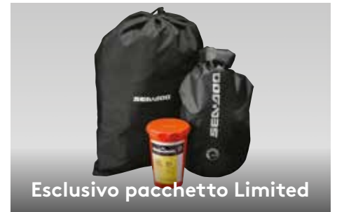
Esclusivo pacchetto Limited

Uno scafo innovativo che rappresenta il nuovo riferimento del settore in termini di manovrabilità nelle acque mosse, stabilità e prestazioni offshore.