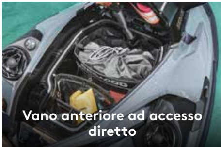
Vano anteriore ad accesso diretto

Ampio vano di carico anteriore facilmente accessibile dalla posizione seduta. 1