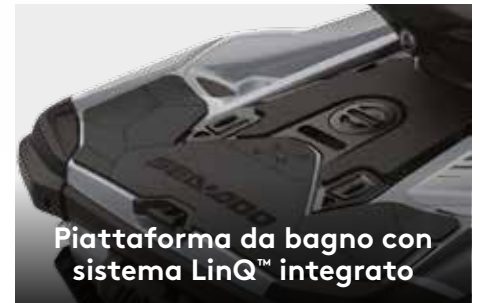
Piattaforma da bagno con sistema LinQ™ integrato

Il primo sistema audio Bluetooth ‡ del settore montato dal costruttore e completamente impermeabile.